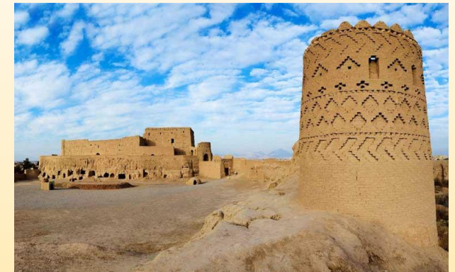
نارین قلعه میبد