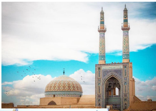
مسجد جامع یزد