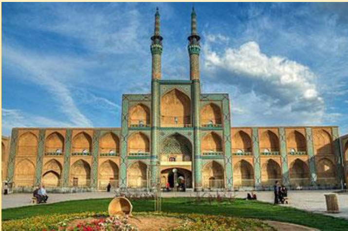
ورودی ایستگاه راه آهن تهران

توجه : ورود دانش آموزان به یزد و برخی از برنامه ها از طریق واتس آپ به همراه عکس به اطلاع اولیاء گرامی خواهد رسید.