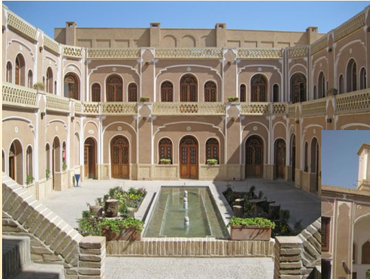
خانه لاری ها